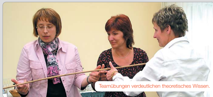
Teamübungen verdeutlichen theoretisches Wissen.

Die thematischen Veranstaltungen werden ebenfalls durch spezialisierte Coaches und Beraterinnen geleitet.